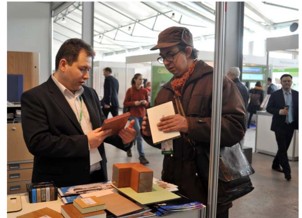
Завод слоистых пластиков: интерьеры из слоистого пластика для метро и других видов транспорта

Ряд разработок участников выставки был представлен на ежегодный конкурс перспективных разработок «Зелёный Свет». Цель конкурса – выявить и отметить новые разработки, внедрение которых оправдано и выгодно с технической и экономической точки зрения. В 2017 году признаны перспективными разработки: Коммутационное оборудование для информационных систем и связи метрополитенов: шкаф кроссовый ШК, представленное НПФ «Электронтехника», г. Брянск; комплект устройств пескоподачи трамвая УПП-7, УПП-8, УПП-9 и УПП-9-01; Блоки тормозных резисторов и блоки силовых резисторов для городского электротранспорта и железнодорожного транспорта; Система отопления, вентиляции и кондиционирования