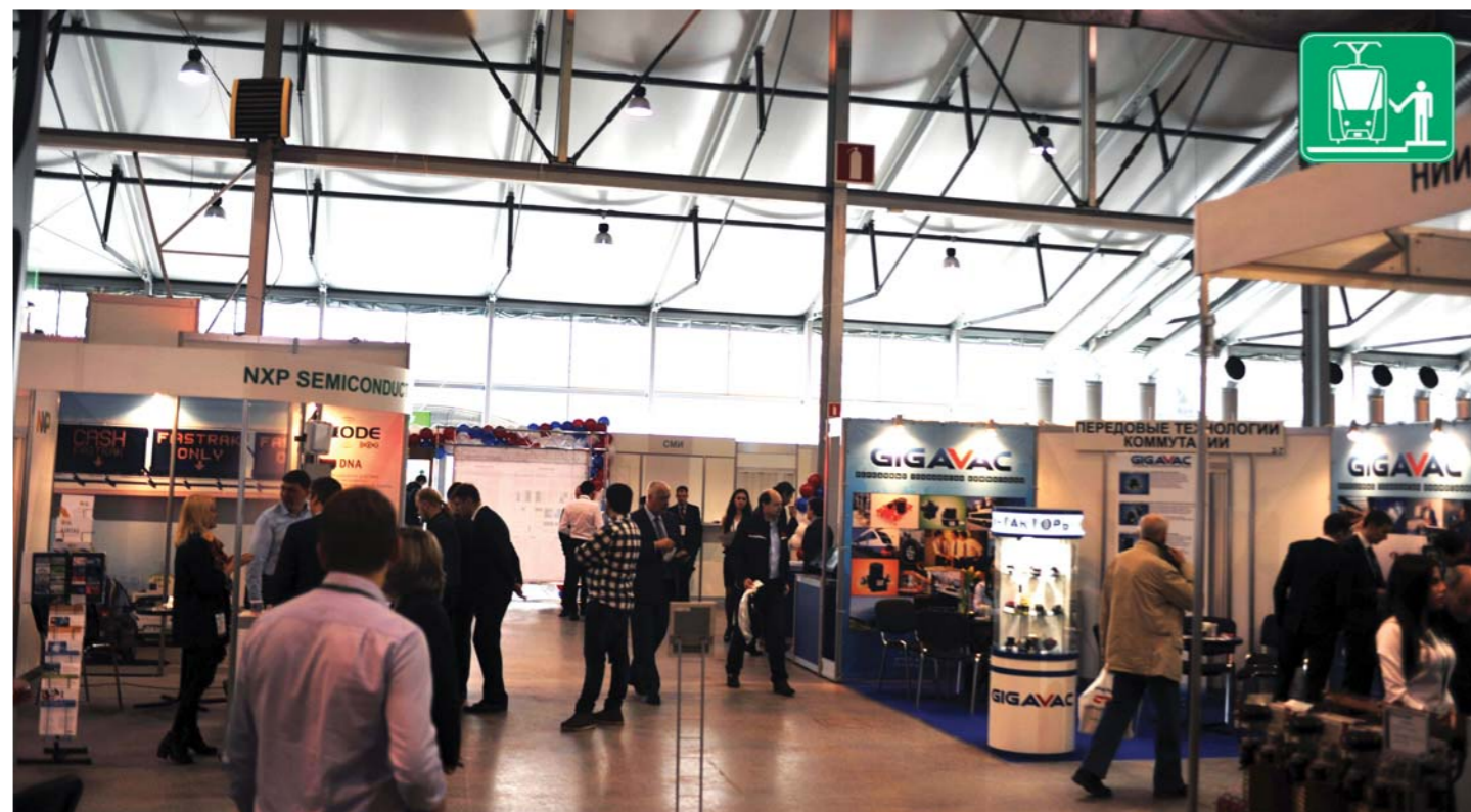
В выставке и деловой программе приняли участие 67 предприятий.

Специалисты и эксперты собрались на «ЭлектроТранс 2017» для обсуждения насущных проблем отрасли, поиска путей сохранения