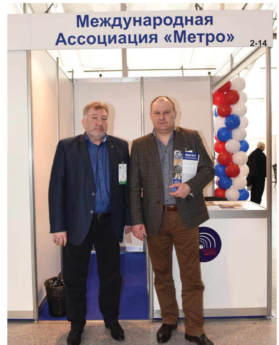
Стенд Международной Ассоциации «Метро»

городского транспорта – одно из приоритетных направлений работы Правительства Москвы. В городе открываются новые станции метро, обновляется транспортная инфраструктура, закупается современный подвижной состав для метро, пригородного ж/д сообщения, наземного транспорта, тестовую эксплуатацию проходят электробусы, развивается сеть зарядных станций для электромобилей».