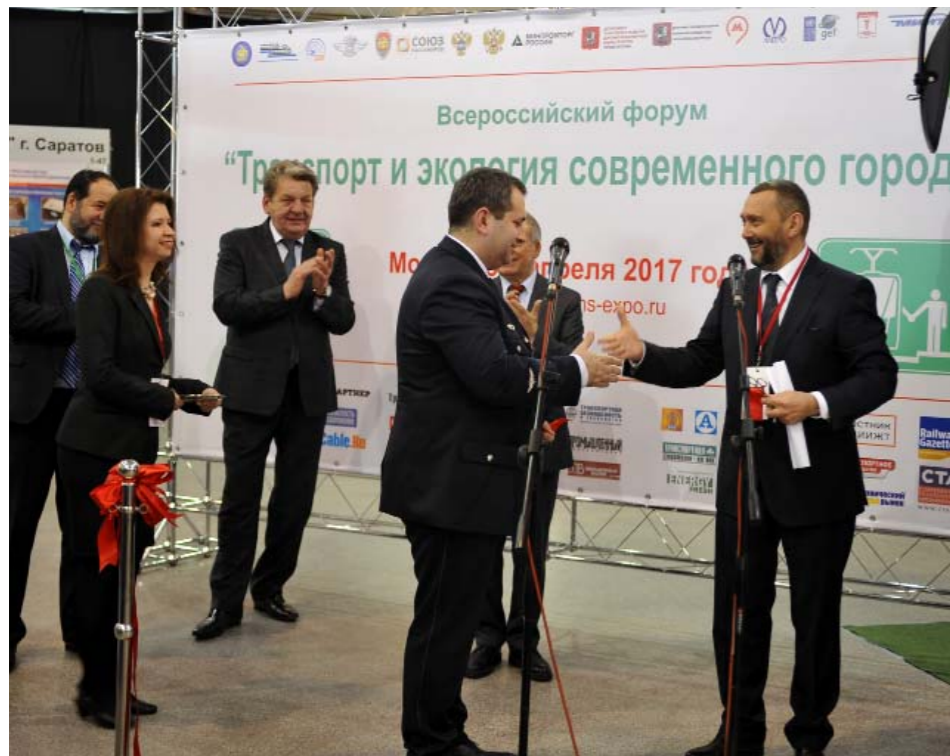
Церемония официального открытия

Дирекция выставки «ЭлектроТранс» К.А. Морозов +7 (495) 287-4412