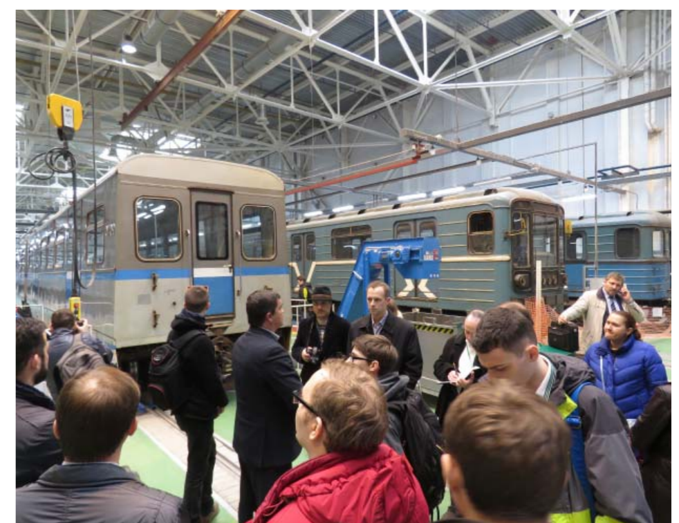
Технический визит в электродепо «Митино»